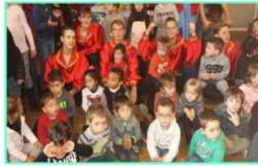
Vive le folklore russe et dansons ensemble