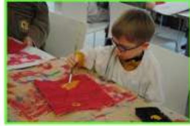
Au Dynamusée, apprenons à peindre à la façon de Garouste