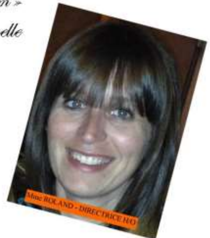
Mrs. BUX AND - DIRECTRICE I.U.

A l'occasion du 60 ème Anniversaire de la tragédie de Marcinelle Le Consulat Général d'Italie et le Bureau Scolaire de Charleroi avec la collaboration des Ecoles fondamentale St. Joseph de Havré et Sainte Catherine de Tamines Ont l'honneur de Vous inviter aux spectacles théâtraux qui auront lieu Dimanche 20 Novembre de 16 h. à 19,30 h. Après de la « Salle Forum » Bois du Cazier à Marcinelle